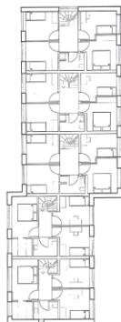
Typisk plan / 1. sal 1:200