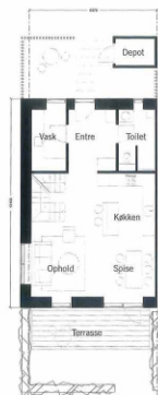
Stue 68m 2 Boliger / 2 etager / Gæve 136m 2 1:100