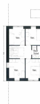
1. Sal 68m 2