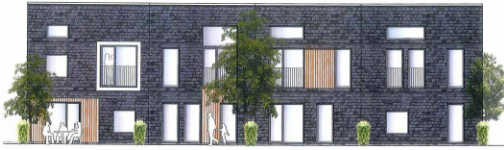
Vest Facade 1:100