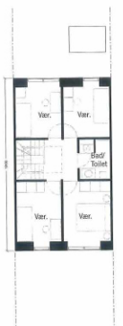
1. Sal 59m 2