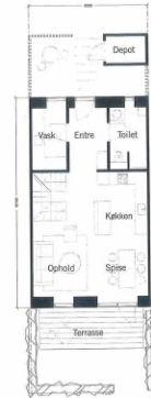
Stue 59m 2 Boliger / 2 etager 118m 2 1:100