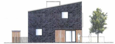
North Facade 1:100