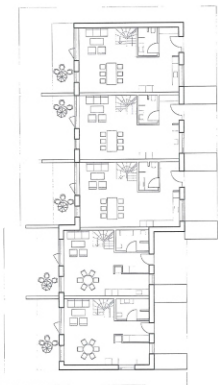
Typisk plan / stuen 1:200